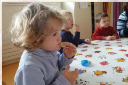
Finalement, le citron c'est bon !