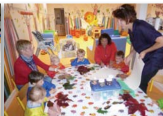
Je fais des traces avec la peinture à doigt sur du papier et des feuilles d'automne !