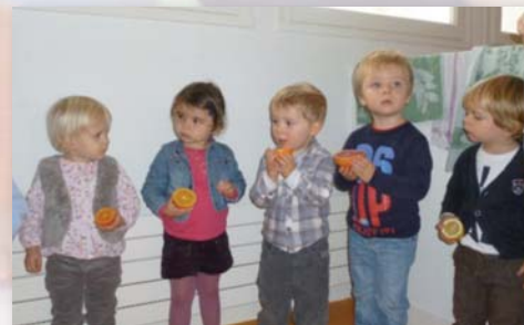
J'attends mon tour pour presser un fruit