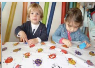
Aujourd'hui je goûte le salé, le sucré, l'acide et l'amer !