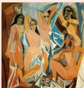
Les demoiselles d'Avignon, PICASSO