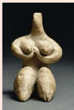
Figurine féminine style halaf, Le Louvre

Tél. 02 31 36 18 05 ou bibliotheque.hermanville@orange.fr