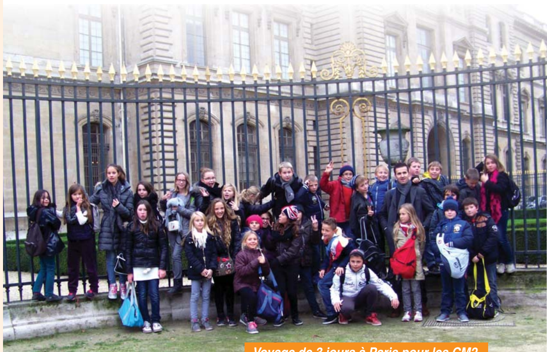
Voyage de 3 jours à Paris pour les CM2 (aides de l'APE et de la mairie).

Intervenante en musique du CP au CE2 (subventionné par la mairie) ■