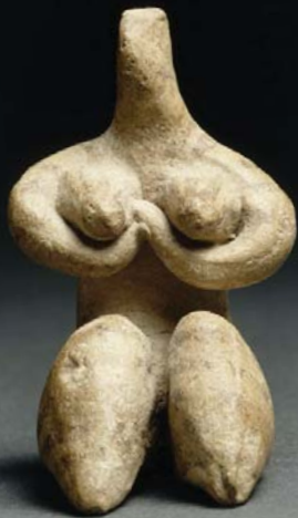
Figurine féminine style halaf, Le Louvre

4 séances à la suite, plus une 5 e de bilan et d'échange Les mercredis 11, 18 et 25 mars et les 1 er et 8 avril 2015 à 19 h