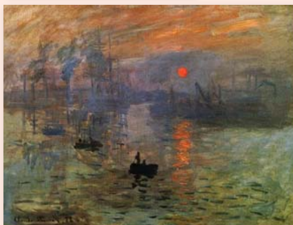
Sunrise, Claude MONET